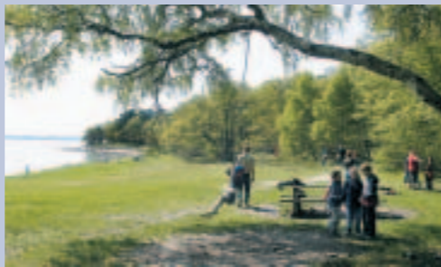
Udsigt langs kysten ved Sandskredet.

Ved Sandskredets P-plads er fine grillsteder, borde/bænkesæt samt mulighed for at springe i bølgerne fra badebroen. Også handicappede har mulighed for at bade fra en handicapvenlig badebro. Fra april til oktober er der adgang til toilethuset, som også er tilgængeligt for handicappede. Skovdistriktet har opsat informationsskilte samt en boks med vandretursfolderen Kongsøre Skov, Odsherred. Sandskredet nås i bil ved at køre fra Hølkerrup ned af Sandskredsvej .