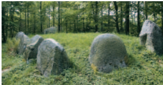
Langdyssen Kong Øres Grav er bygget af kæmpestore sten sat i en oval om stenkammeret bestående af fire sten og en overligger. Oprindeligt har gravkammeret været dækket af jord, som delvist må være fjernet, når man skulle gennemføre en ny gravlæggelse

når han levede, forlyder der desværre ikke noget om. Ved stendyssen Tingstedet (3) , som ligger få hundrede meter fra P-pladsen, mødes fortid og nutid, når man mellem de store bautasten ser Kyndbyværket rejse sig i horisonten. I den nordlige ende af skoven passerer militære træningsbaner for blandt andet frømandskorpset.