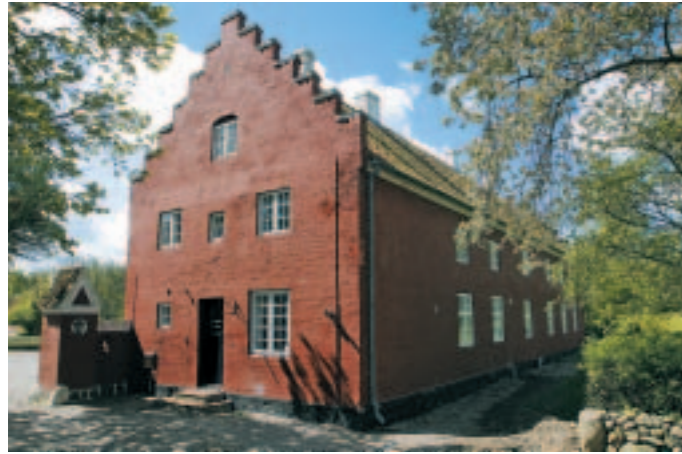
Portnerboligen til Anneberggård med fine takkede gavle.

Avlsgården og den fine portnerbolig (9) har siden 1916 været skilt fra hovedbygningen. I 2003 overtog Odsherred Kulturhistoriske Museum imidlertid avlsbygningerne, og planen er nu sammen med skovdistriktet at genskabe muligheden for at opleve hovedgården i sin helhed.