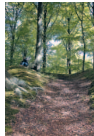
Manglebjerg indbyder til bjergbestigning.

Skoven blev samlet i 1770'erne af skovarealer hørende til de omkringliggende landsbyer og styrket ved, at der blev plantet nye træer. I store træk den samme historie som for Kongsøre Skov . Det smukkeste gamle stengærde kanter hele skoven, men ses bedst fra Skaverupvej langs sydsiden af skoven eller Egebjergvej langs østsiden af skoven.