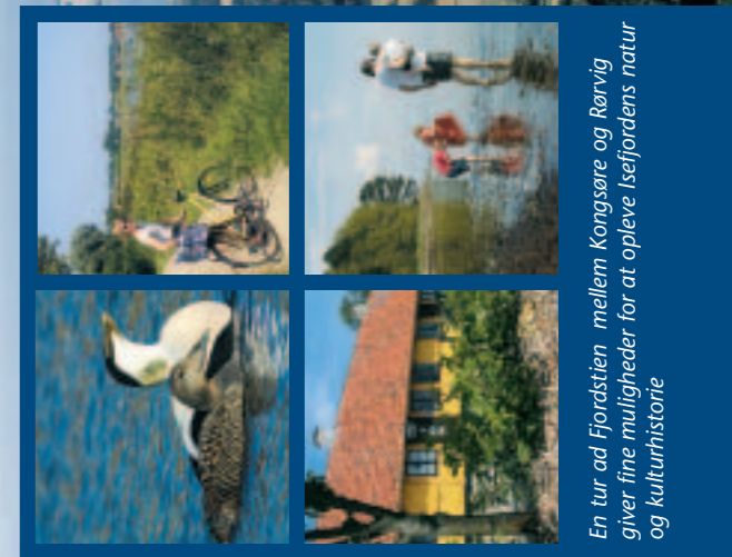
En tur ad Fjordstien mellem Kongsøre og Rørvig giver fine muligheder for at opleve Isefjordens natur og kulturhistorie