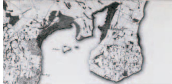
Generalkvartermesterstabens kort, opmålt i årene 1810-1821. Kortet viser Ringholm og Hov Vig før inddæmningerne.

da landet hævede sig, hvorved Nakke og Nørrevang - hjulpet på vej af aflejret grus og sand - blev kittet sammen med fastlandet. I 1869 blev også Ringholm føjet til halvøen, da man ved hjælp af dæmninger tørlagde fjorden bag ved holmen.