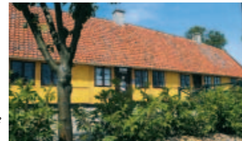
Lodsoldermandsgården i Rørvig Havn

På Rørvig Havn ligger den fredede bygning Lodsoldermandsgården (14) , som blev bygget i 1660. Den hed oprindelig Rørvig Toldstation , og udover toldfunktionen blev al lodsvirksomhed organiseret herfra gennem mere end 300 år. Alle skibe, som ville ind gennem Isefjorden eller Roskilde Fjord , måtte tidligere tage en lods ombord. Fiskerne i Rørvig havde alle kort på hånden for at løse opgaven, for de havde et nøje kendskab til de sandbanker i fjordens gab, som gjorde sejladserne til en risikabel affære. Samtidig skulle skibene fortolde. Det skete, mens de lå i den dybe vig bag Skansehage . På havnen ligger også røgeriet, hvor det er fristende at proviantere lidt her ved slutningen af - eller starten på - en tur ad Fjordstien mellem Kongsøre og Rørvig .