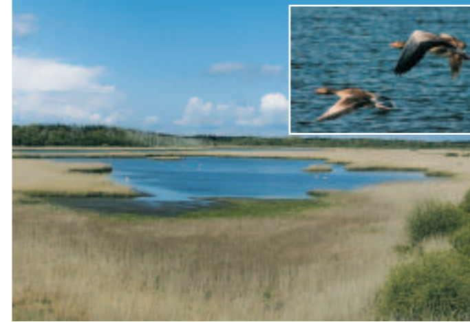
Ved dæmningen er opsat et fugletårn, hvorfra der er gode muligheder for at iagttage fuglelivet

vat. Det betyder, at man - af hensyn til fuglene - ikke må gå ud i rørskoven og de indhegnede områder. Til gengæld har skovdistriktet afmærket flere vandreture med udgangspunkt i de afmærkede P-pladser. Der er opsat informationsskilte og bokse med en vandretursfolder for området.