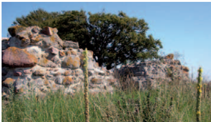
Kirkeruinen med kongelys i forgrunden.

Eskildsø (12) er med sine 140 hektarer den største og eneste opdyrkede ø i Roskilde Fjord. Øen hørte i middelalderen sammen med Selsø Hovedgård under den mægtige Roskilde-bisp. Omkring 1100 oprettedes et augustinerkloster på øen, som med sin beliggenhed lå strategisk midt i vandvejen til Roskilde. Klosteret blev dog snart flyttet til Æbelholt i Nordsjælland. Klosterets beliggenhed er aldrig fundet, men man kan se de betydelige kirkeruiner og finde en række lægeplanter, som