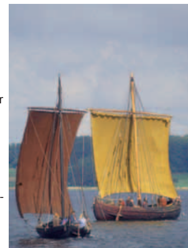
Kopier af Skuldelevskibene på Roskilde Fjord. Det havgående handelsskib, "Ottar" er en kopi af Skuldelev 1, og det mindre handelsskib "Roar Ege" er en kopi af Skuldelev 3.

Skibene blev sænket i slutningen af 1000-tallet for at indsnævre indsejlingen til Roskilde, som dengang var 'hovedstaden'. Roskilde Fjord var derfor en af de vigtigste færdselsårer. Også andre sejlløb har været spærrede, som oftest med nedbankede pæle og andet træværk. Sænknin-gen af skibene tolkes derfor som en akut situation, hvor man meget hurtigt har skullet skabe en spærring. Skuldelevskibene kan ses på Vikingskibsmuseet i Roskilde.