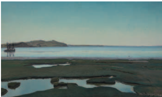
L.A. Ring "Sommerdag ved Roskilde Fjord". 1900 Olie på lærred.